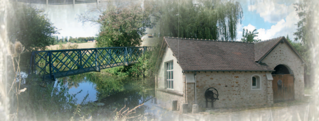
Un paysage façonné par les fermes briardes et arrosé par l'Yerres, autrefois bordée de moulins